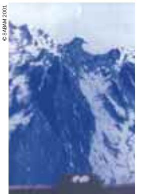
René Magritte "Le domaine d'Arnheim" 1962

Dossier : Sylvie Bourguignon Mise en page : Olagil