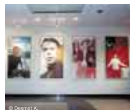
La salle internationale Jacques Brel à la SABAM