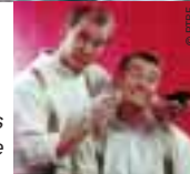
Les frères Taloche