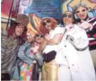
Les Gauff'au suc