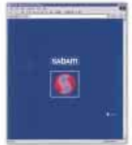
Le nouveau logo : une création de Paul Louka

La SABAM vous propose, depuis juin 2001, une nouvelle version de son site Internet. Plus beau, plus pratique, plus complet, ce site permet aux membres de la SABAM tout comme au grand public de mieux connaître les missions et le rôle de la société d'auteurs, de savoir qui sont ses membres, de promouvoir les artistes, de se renseigner sur des questions juridiques précises, de faire les démarches pour utiliser l'œuvre d'un membre, de télécharger des textes de loi, etc ... Visite d'un site de référence!